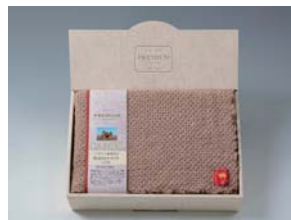
箱タイプ(大・中・小)